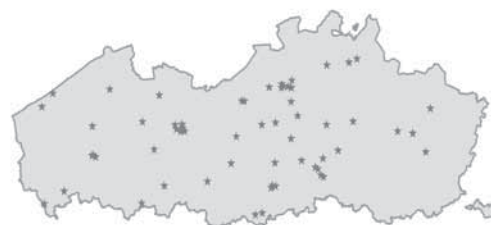
Verspreiding haltes keukenbus